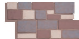
自然石 - 岩燒 1195 × 595 × 35 mm