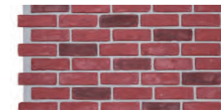
火紅磚 1094 × 613 × 23 mm