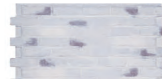
POLO 磚 1115 × 615 × 25 mm