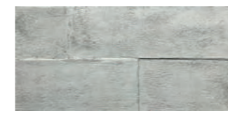
預鑄牆-鑄模 600 × 1200 × 20 mm