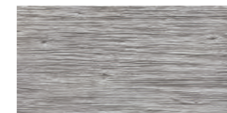
預鑄牆-刷紋 600 × 1200 × 20 mm