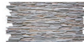
千層石 1210 × 770 × 30 mm