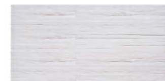
白玉石 600 × 300 × 22 mm