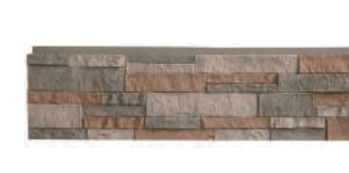
礁岩石 1223 × 327 × 38 mm