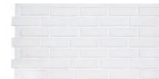
古白磚 1094 × 613 × 23 mm