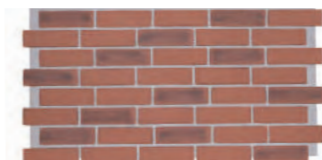
仿古磚 1065 × 570 × 20 mm